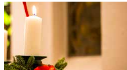
Julekoncert med kirkekoret